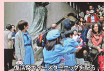
復活祭でイースターエッグを配る

によって構成されています。どなたでも随時入会できます。生涯の仲間と出会うチャンスです。一緒に活動しませんか。毎月第1日曜日9時からと、月に2回ほど土曜日の午前10時～12時に地下3番会議室で集会を行っています。連絡先(090-1078-9998 東)