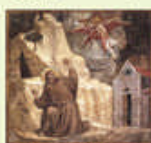
ジョット「聖痕を受ける聖フランシスコ」1325年

キリストの言葉に従順に生きる彼に感化を受けた人々が次第に集い、1210年に「小さき兄弟会」(現フランシスコ会)を創