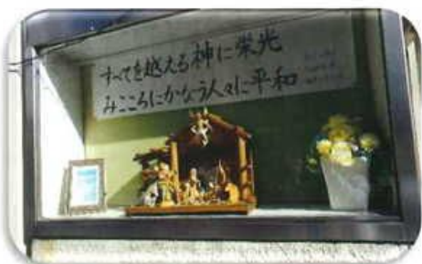
河原町通り門の掲示板