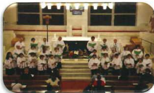
12月24日チャリティーコンサート