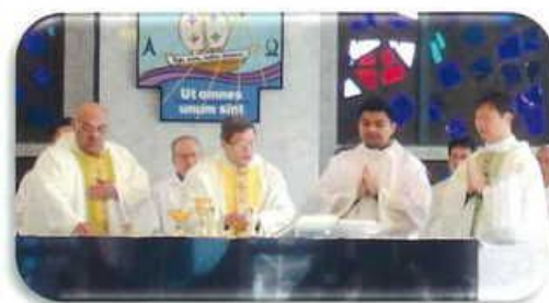
1月6日教区司祭修道者新年ミサ