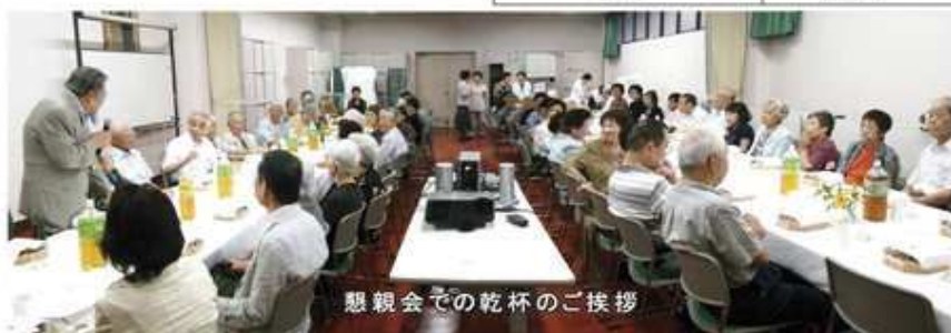
懇親会での乾杯のご挨拶